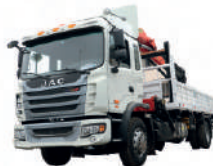
Camión hidrogrúa Jac D6A-917