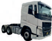
Remolque volvo FH6X4T C9T711