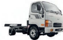
Camión Hino P3Q-861