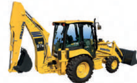
Retroexcavadoras:Komatsu WB-97R Caterpillar 420 E/420F2