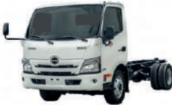
Camión Hino PEJ-771