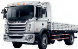
Camión Jac BBG-916